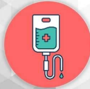
การให้ยาเคมีบำบัด