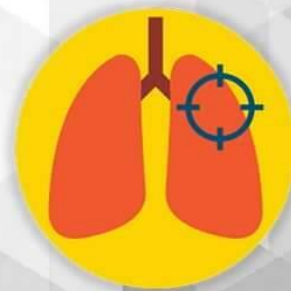
การรักษาแบบเฉพาะทาง