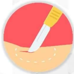
การผ่าตัด