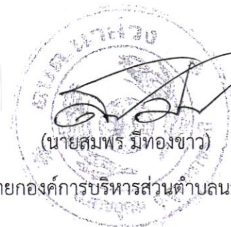
นายกองค์การบริหารส่วนตำบลนาสว่าง