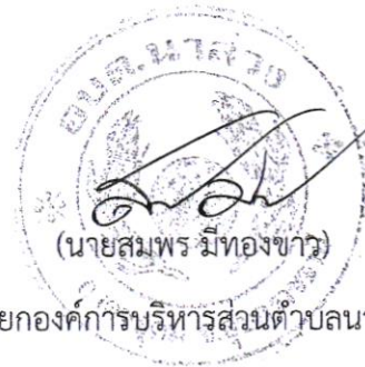
นายกองค์การบริหารส่วนตำบลนาสว่าง